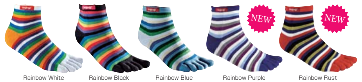
Rainbow White Rainbow Black Rainbow Blue Rainbow Purple Rainbow Rust

素材 ポリエステル70%、ナイロン25%、ポリウレタン5%。 クールマックス®EcoMadeファブリック、ライクラ®ファイバー使用。 サイズ S、M、L